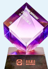
猎聘 全国非凡雇主