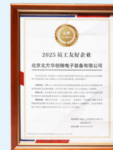
国聘 员工友好企业